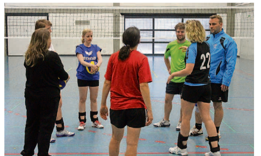
Nach jeder Lehrübung analysierten die Prüflinge mit den Kursteilnehmenden im Gespräch die vergangene Lektion.

Für diesen praktischen Teil mussten die Teilnehmenden eine 90-minütige Lektion vorbereiten und davon 20 Minuten demonstrieren. Während das Zeitmanagement wenig Probleme verursachte, war das Umsetzen von niveauangepassten